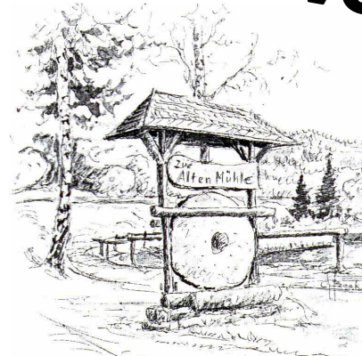
Alte Mühle mit Backhaus